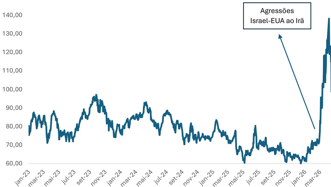
Gráfico. Preço petróleo tipo Brent (US$ barril) - 2023 – 2026*